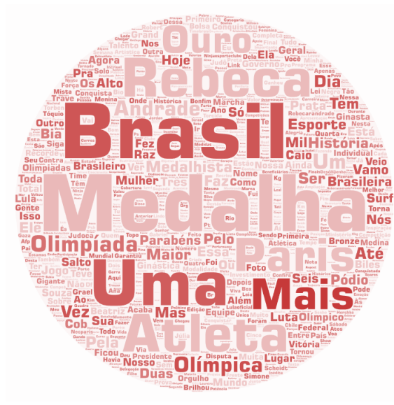
Imagem 5. Nuvem de palavras de termos presentes nas publicações de esquerda sobre a temática analisada

A nuvem de palavras das publicações de esquerda, por sua vez, priorizou as medalhas, com foco nas conquistas.