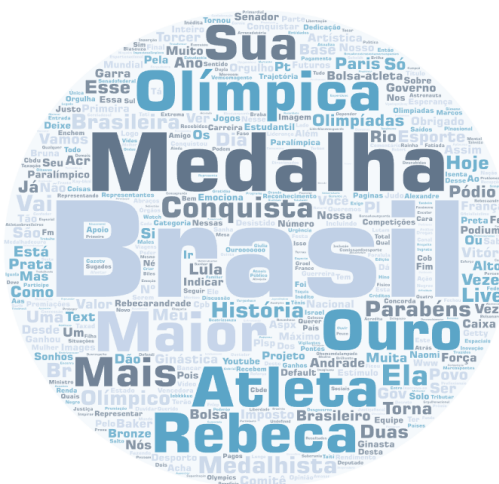
Imagem 1. Nuvem de palavras de termos presentes nas publicações de direita sobre a temática analisada

A nuvem de palavras destaca os termos mais frequentes nas publicações da direita sobre as Olimpíadas. O termo mais proeminente é "Brasil", seguido por "Medalha" e "Olimpica". Notamos que a direita priorizou uma narrativa nacionalista, sobre o país, antes dos atletas vitoriosos. Na nuvem da direita, termos como "Maior" e "Conquista" se destacam mais, refletindo talvez uma retórica de exaltação à grandeza e ao sucesso. A Imagem 2, abaixo, apresenta as palavras utilizadas pela esquerda e nos permite comparar as narrativas escolhidas pelos dois campos ao abordar o mesmo tema.