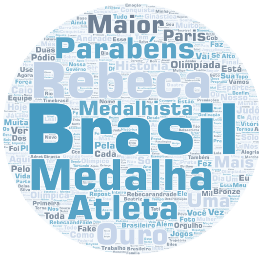
Imagem 4. Nuvem de palavras de termos presentes nas publicações de direita sobre a temática analisada

A nuvem de palavras apresentada repete a estratégia do Facebook: o termo mais proeminente é "Brasil", com uma narrativa do país antes dos atletas vitoriosos.